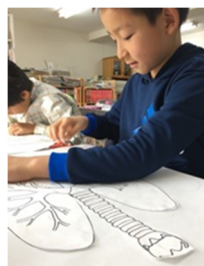
<胸部ワークショップの様子>