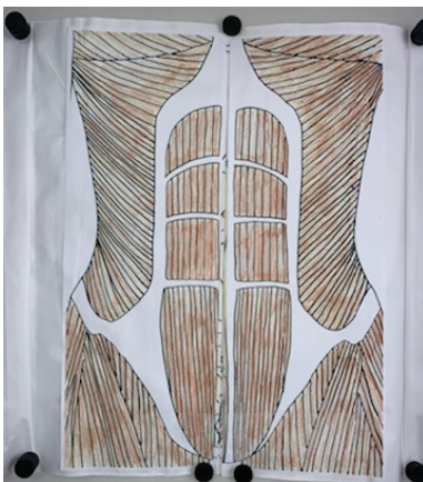
<腹部解剖の絵本より一例>

※持ち物:筆記用具・絵の具が手につくのが嫌な方は ビニール手袋と輪ゴム があると便利です ※汚れてもいい服装もしくは、 エプロン 等をお持ちください