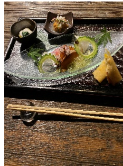
蔵元料理「吟望」前菜