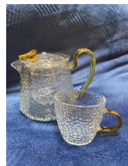
耐熱ガラスのポット・カップ