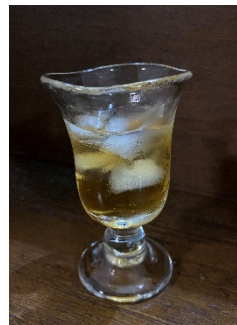
原光弘の酒器・11年梅酒