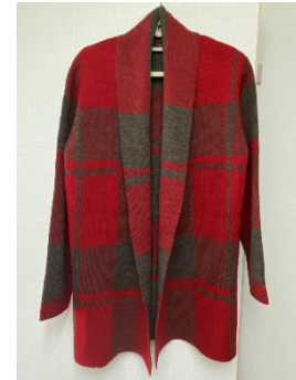
毛糸のカーディガン