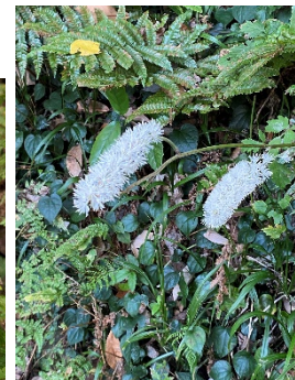
サラシナショウマ