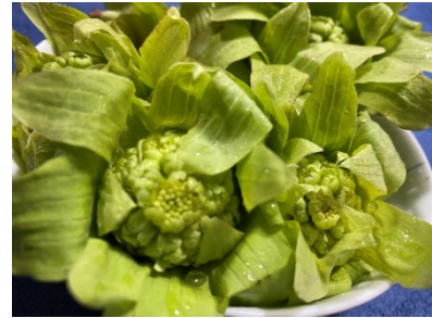
深夜便で山形から届いた落の臺