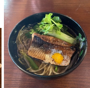
身欠鯧根付芹入り温麺蕎麦