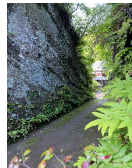
神武寺への入り口