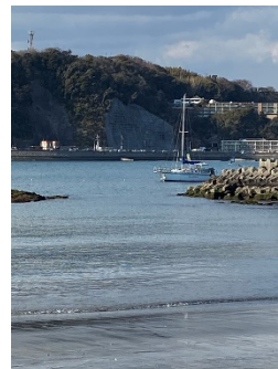
鎌摺海岸から逗子湾