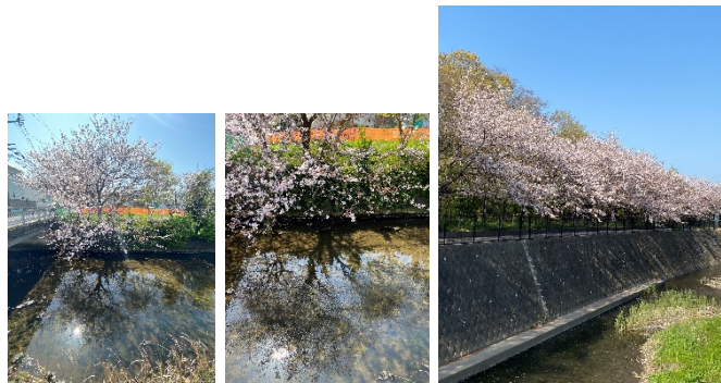
(逗子開成裏手の田越川)