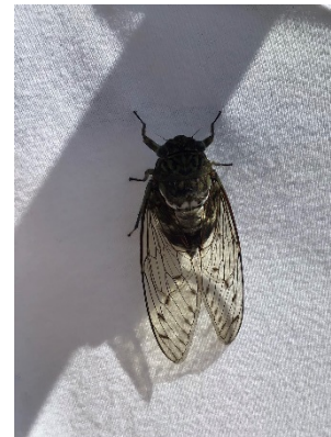
わが家の洗濯物に留まるミンミンゼミ