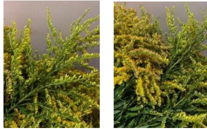
摘んできたセイタカアワダチソウの束(薬草でもある)