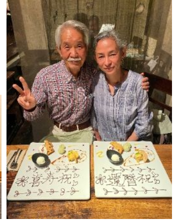
(令和4年)妻:還暦/夫:喜寿を祝い