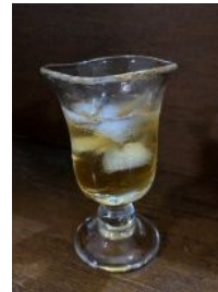
原光弘の酒器・11年梅酒