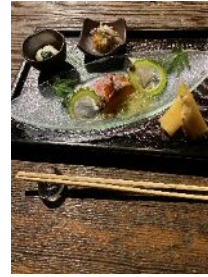
蔵元料理“吟望”前菜