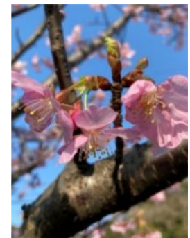
河津桜2/14逗子第一運動公園