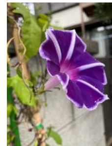
キキョウアサガオ