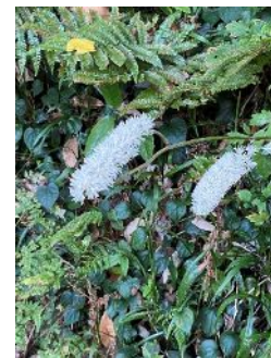
サラシナショウマ