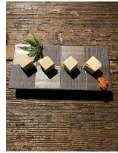
吟醸粕漬クリームチーズ