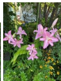
ピンクカサブランカ