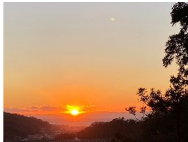
神武寺参道からの落日