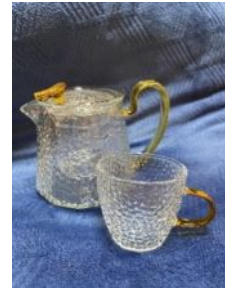
耐熱ガラスのポット・カップ