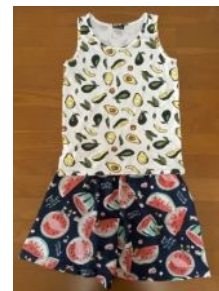
上:アボガド/下:スイカ