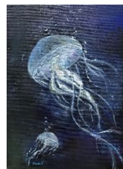
クラゲ(油絵) by kumi