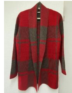
毛糸のカーディガン